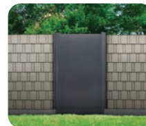
Module Tôle Perforée