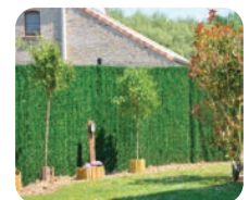
Canada Super zichtremmer