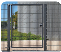
Portillon Treillis soudé