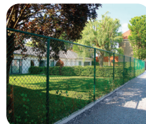
Clôture Simple Torsion