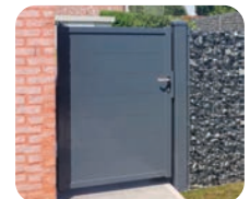
Alzebra Blind 200 draaipoort