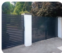
Alzebra 80 poort